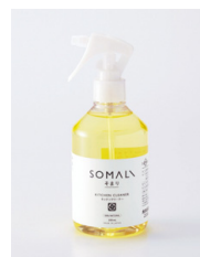
SOMALI キッチンクリーナー 300ml：¥1,100 (税込)

天然素材の優しさと石けん職人のこだわりが詰まった、くらしに寄り添うハウスケア & ボディケアブランドです。家族みんなが安心してお使いいただける商品をお届けしています。