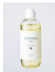
SOMALI 台所用石けん 300ml：¥1,100 (税込)

純石けん分に、天然オレンジの皮から抽出したオレンジオイルを配合したキッチンクリーナー。換気扇やレンジなど、キッチン周りの頑固な油污れやヌメリを分解して落とします。爽やかな香りで、毎日の家事を楽しくしましょう!