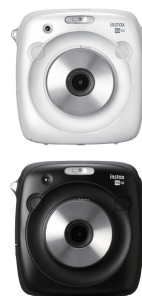
instax SQUARE SQ10

「撮ル」をあそぼう」をコンセプトに、多彩な機能、洗練されたデザインとあざやかなカラーが特徴。男女問わず愛用されている商品です。