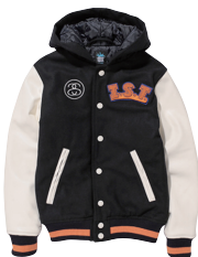
Kids I.S.T. Varsity Jacket ¥18,500 (税抜)

秋冬のカジュアルファッションシーンでも特別な存在感をはなつ、パーシテジャケットの2014年版モデル。