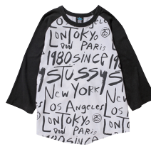
Kids Scribble 3/4 Raglan Crew ¥5,000 (税抜)

秋冬のカジュアルファッションシーンでも特別な存在感をはなつ、パーシテジャケットの2014年版モデル。