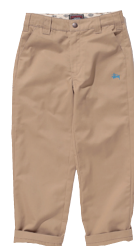
Stussy Kids x Dickies Chino Pant ¥7,500 (税抜)

世界5大都市のネームを落書きのよいうなハンドドローイングで表現した、ラグランスリーブTシャツ。