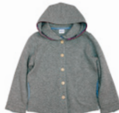
ジャケット (80~150cm) ¥7,350~/SHIPS