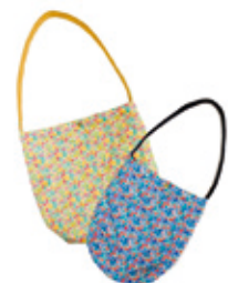
バッグ (S) ¥5,040、 (M) ¥6,090 / SHIPS

【お問い合わせ先】 SHIPS 二子玉川店 ☎ 03-5716-6346 www.shipltd.co.jp