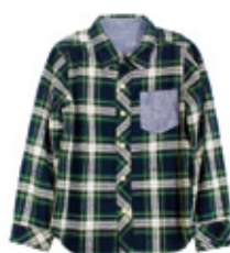
シャツ (80~160cm) ¥6,615~/SHIPS

シップス オンラインショップ: onlineshop.shipltd.co.jp