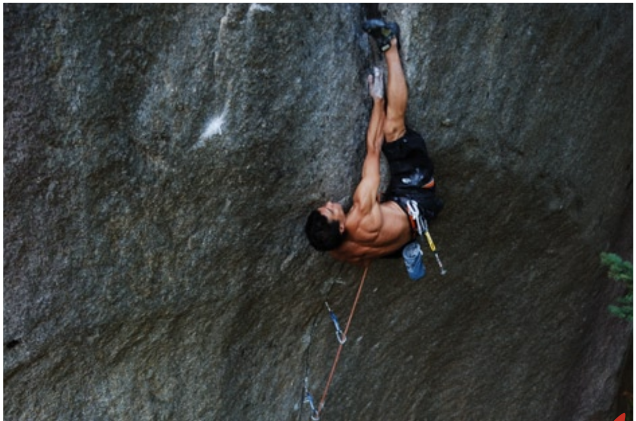
取材協力:平山ユージ

ぼくは「reck®(レック)。アフリカのタンザニアでくらす、クライミングのエキスパートだ。みんなはロッククライミングというスポーツを知ってるかな? 英語で「ロック」は「岩」、「クライミング」は「のぼる」。つまりロッククライミングとは、岩をのぼるスポーツなんだ。世界には美しく大きな岩がたくさんあるから、ぼくはいつもなかまと一緒に、たった1本のロープをからだにまきつけて、大きな岩にいどんでいるんだ。もちろんこわいときもあるけれど、頭とからだを同時にうごかしながら岩のてっぺんをめざすクライミングは、一度、体験したらやめられないふしぎなみりよくのあるスポーツだと思おう。