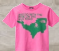
Ras Tee ¥3,150 (80 ~ 150cm)