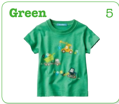
Green 5 みどり：しよくぶつのイメージ おだやかなきもちになる色