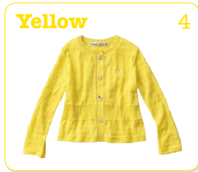
Yellow 4 きいろ：ひかりのイメージ やる気がでてくる色