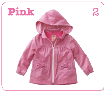
Pink 2 ピンク：しあわせのイメージ やさしいきもちになる色