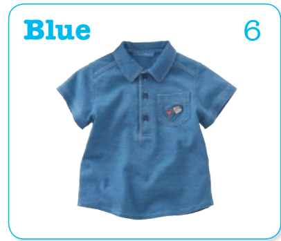
Blue 6 あお：空や海のイメージ さわやかなきもちになる色