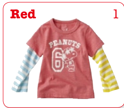
Red 1 あか：たいようのイメージ エネルギーがあふれて、元気になる色

あか、きいろ、あお、みどり…この世界にはいろいろな色があるけれど、きみの好きな色は、どんな色？ 毎日 まいにち きているふくにもいろいろな色があるけれど、色には、こんなちからがあるって知ってたかな？