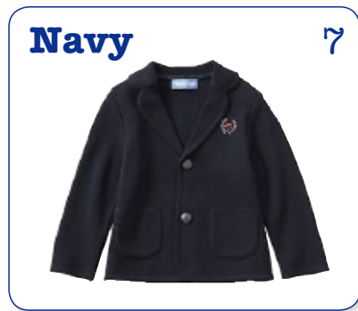
Navy 7 あいいろ：よぞらのイメージ おちついたきもちになれる色