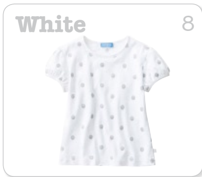
White 8 しろ：まっさらなイメージ せいけつかんをかんじられる色