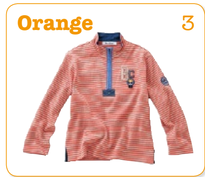
Orange 3 オレンジ：夕日のイメージ あかるくてたのしいきもちになる色