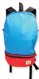
2WAY バッグ ¥6,500 (税抜)

シップス オンラインショップ: onlineshop.shipsltd.co.jp