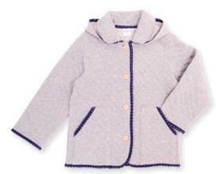
キルトジャケット (80 ~ 150cm) ¥7,000 (税抜) ~

【お問い合わせ先】 SHIPS 二子玉川店 ☎ 03-5716-6346 www.shipsltd.co.jp