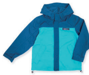
3WAY ジャケット (80 ~ 160cm) ¥12,000 (税抜) ~