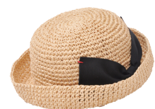
ハット ¥3,900 (税抜) 4月中旬入荷予定