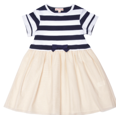
ワンピース ¥5,900 (税抜)

グリーンレーベル リラクシングのシーズンテーマは、「MADE WITH LOVE」~子どもは愛で成長する。親と子どもがおそろいの服を着て一緒に楽しく過ごす時間は、とてもしあわせで、とても短くて、大切な時間。グリーンレーベル リラクシングの春夏の子ども服は、プレッピースタイルをベースに「少し背伸びをしたかわいらしさ」をプラスした、親子で楽しめる大人スタイルを提案します。