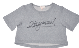
カットソー ¥3,400 (税抜)