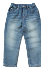
デニムパンツ ¥3,700(税抜)

【お問い合わせ】 株式会社ユニテッドアローズ お客様相談室 ☎ 0120-011-031 (受付時間 10:00 ~ 18:30 土・日、年末年始を除く) www.green-label-relaxing.jp