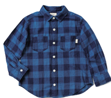
チェックシャツ ¥4,600(税抜)

グリーンレーベル リラクシングの今シーズンのテーマは、「Beauty will save the world ~美は地球を救う~」。「美」とは知性であり、「モノ」に深みを与えるもの。そしてファッションとは、着る人に高揚感を与えるもの。美しさと文化的役割を持ったファッションというカルチャーを再考し、ファッションの力を蘇らせること。それがグリーンレーベル リラクシングの秋冬のテーマです。「ファッション=美+文化」の可能性を追求することが、グリーンレーベル リラクシングの役割だと考えています。