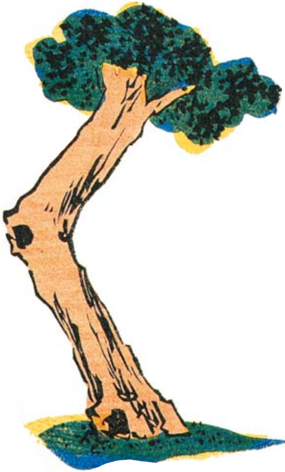
5. パスポートや50円硬貨にも描かれている植物