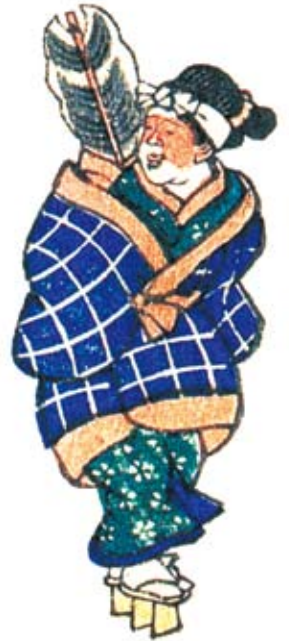
9. 民家やその近くに暮らし、家を守るといわれるトカゲの仲間