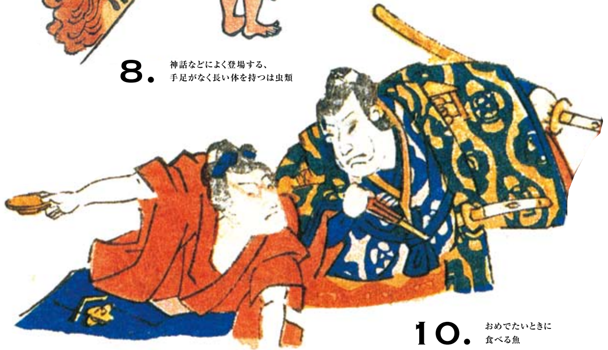
10. おめでたいときに食べる魚