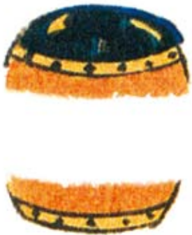
7. 吸盤のある8本足を持ち、海にすむ生き物