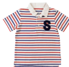
ポロシャツ (80 ~ 160cm) ¥5,775 ~ / SHIPS