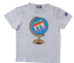
Tシャツ (80 ~ 160cm) ¥4,200 ~ / ships mammoth

【お問い合わせ先】 SHIPS 二子玉川店 ☎ 03-5716-6346 www.shipsltd.co.jp