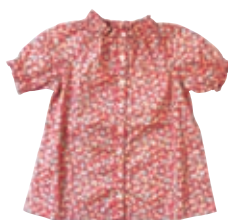
ブラウス (80 ~ 150cm) ¥6,720 ~ / SHIPS

シップス オンラインショップ: onlineshop.shipsltd.co.jp