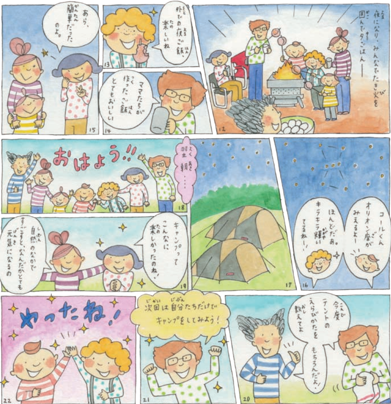
イラスト：猪原美佳