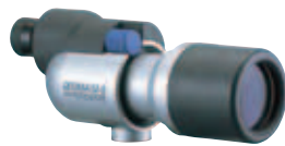
フィールドスコープ

警戒心強い野鳥に近づかずに、じっくり野鳥をみることができる。鳥の行動や、色やかたちなどをゆっくりとかんさつできる。